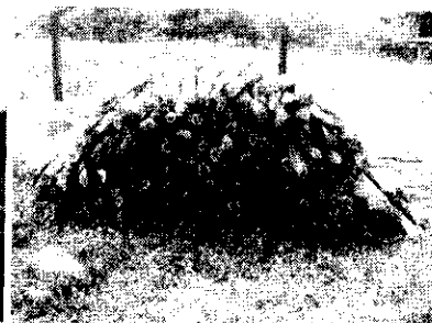
Madera acopiada en el sitio

En sendas fotografías anexas se puede demostrar el producto decomisado.